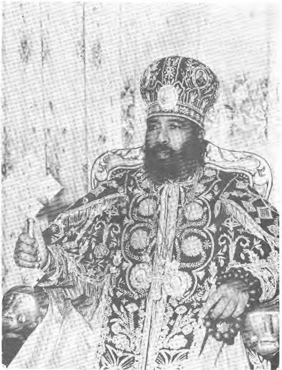
ብፁዕ ወቅዱስ ኣቡነ ጳውሎስ ፓትርያርክ ርእሰ ሊቃነጻጻሳት ዘኢትዮጵያ ወእጨጌ ዘመንበረ ተክለሃይማኖት